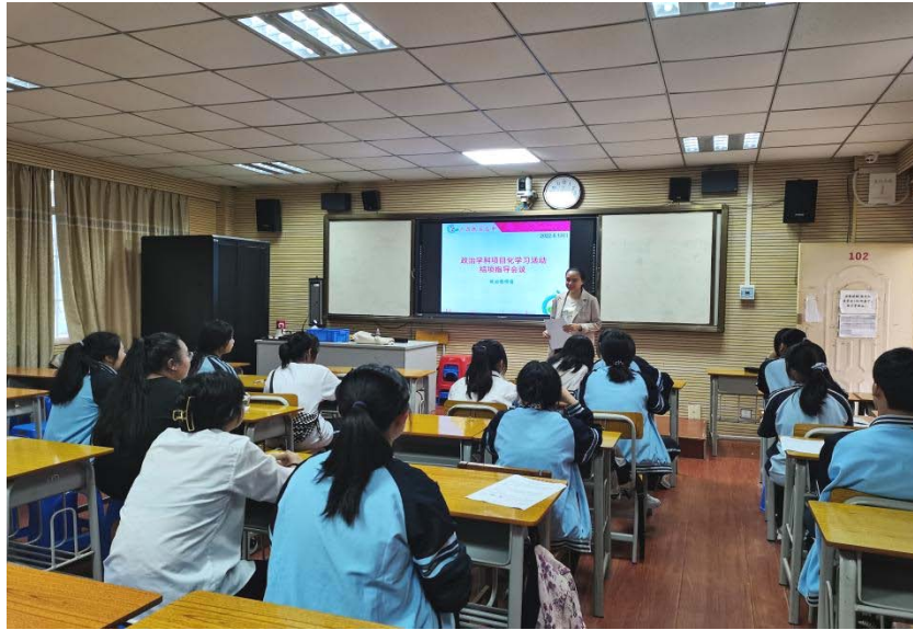
项目化教学--结项指导会