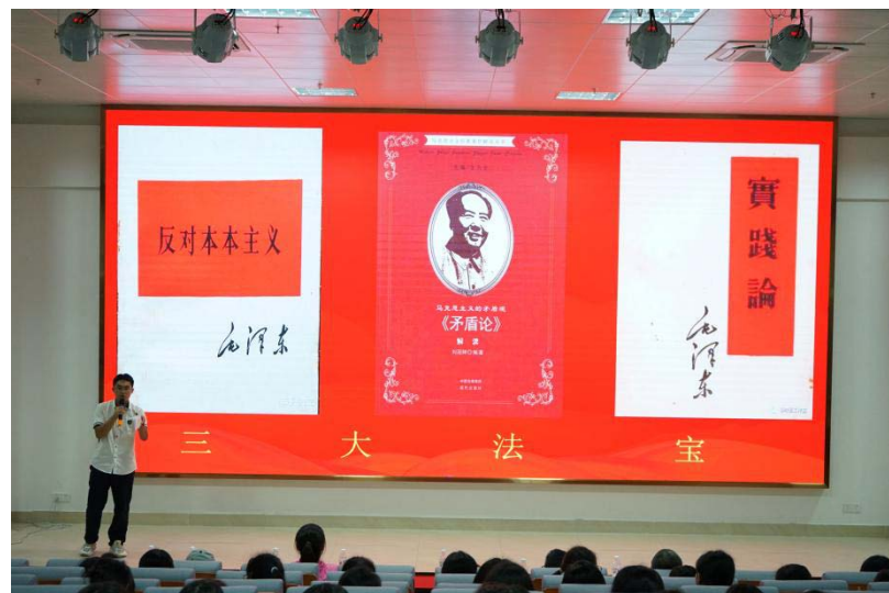
铁道游击队进行《毛泽东哲学的解读与推广》主题项目的汇报 项目小组在学习汇报后，进行了精彩的成果展示。