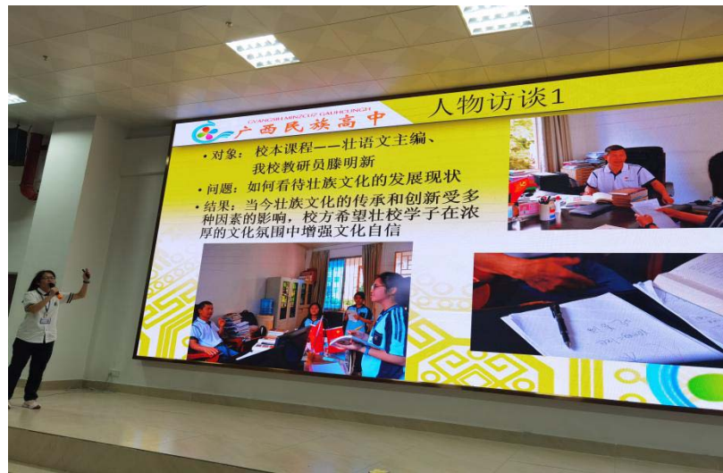
凌云壮志小组进行《壮族文化在校园内的传承与创新》主题项目汇报